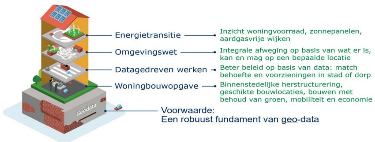
Afbeelding: nationale geo-informatie infrastructuur (NGII) als basis voor maatschappelijke vraagstukken

In ons land worden GEO-basisgegevens jaarlijks meer dan 5 miljard keer gebruikt via de landelijke voorzieningen. Indirect gebruik, via bijvoorbeeld de doorlevering van geodata door fabrikanten van navigatiesoftware, komt daar nog bovenop. Het gebruik blijft jaarlijks stijgen en het maatschappelijk belang van deze gegevens, als onderdeel van de geo-informatie infrastructuur, is daarmee groot. Het is daarom cruciaal om de gegevenskwaliteit landelijk op peil te houden.