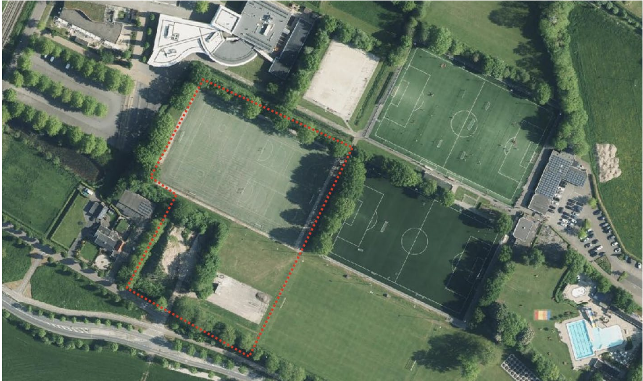
Figuur 2: luchtfoto huidige situatie plangebied