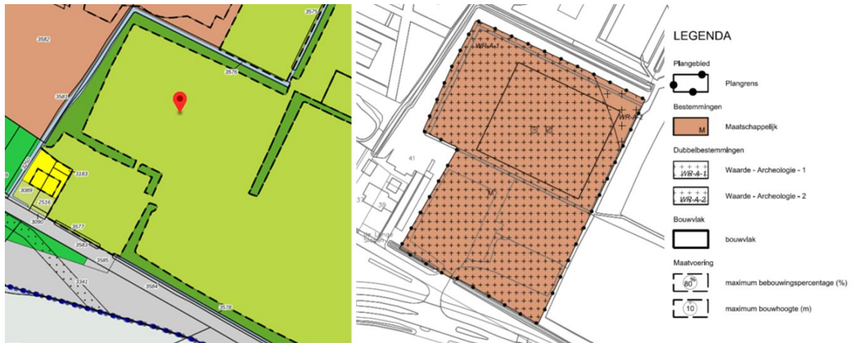
Figuur 4: vigerend bestemmingsplan (links) en beoogde wijziging bestemmingsplan voor kindcentrum Wijhe (rechts)

In het beoogde nieuwe bestemmingsplan (zie rechts in figuur 4) wordt de bestemming ‘recreatie – dagrecreatie’ volledig omgezet naar ‘maatschappelijk’ (bedoeld voor maatschappelijke voorzieningen zoals schoolgebouwen). Voor het kindcentrum wordt vervolgens een bouwvlak opgenomen met een oppervlakte van 4.200 m 2 . In de regels is opgenomen dat dit bouwvlak voor maximaal 80% bebouwd mag worden en dat de maximale bouwhoogte 10 meter bedraagt. De voorlopige plannen voor het gebouw passen binnen deze kaders. Er volgt nog een ontwerptraject voor het gebouw. Door een ruimer bouwvlak en een hogere bouwhoogte op te nemen is er tijdens de verdere uitwerking vrijheid om een mooi architectonisch ontwerp te maken. Wanneer dit architectonische ontwerp gereed is wordt hiervoor een procedure voor een omgevingsvergunning doorlopen.